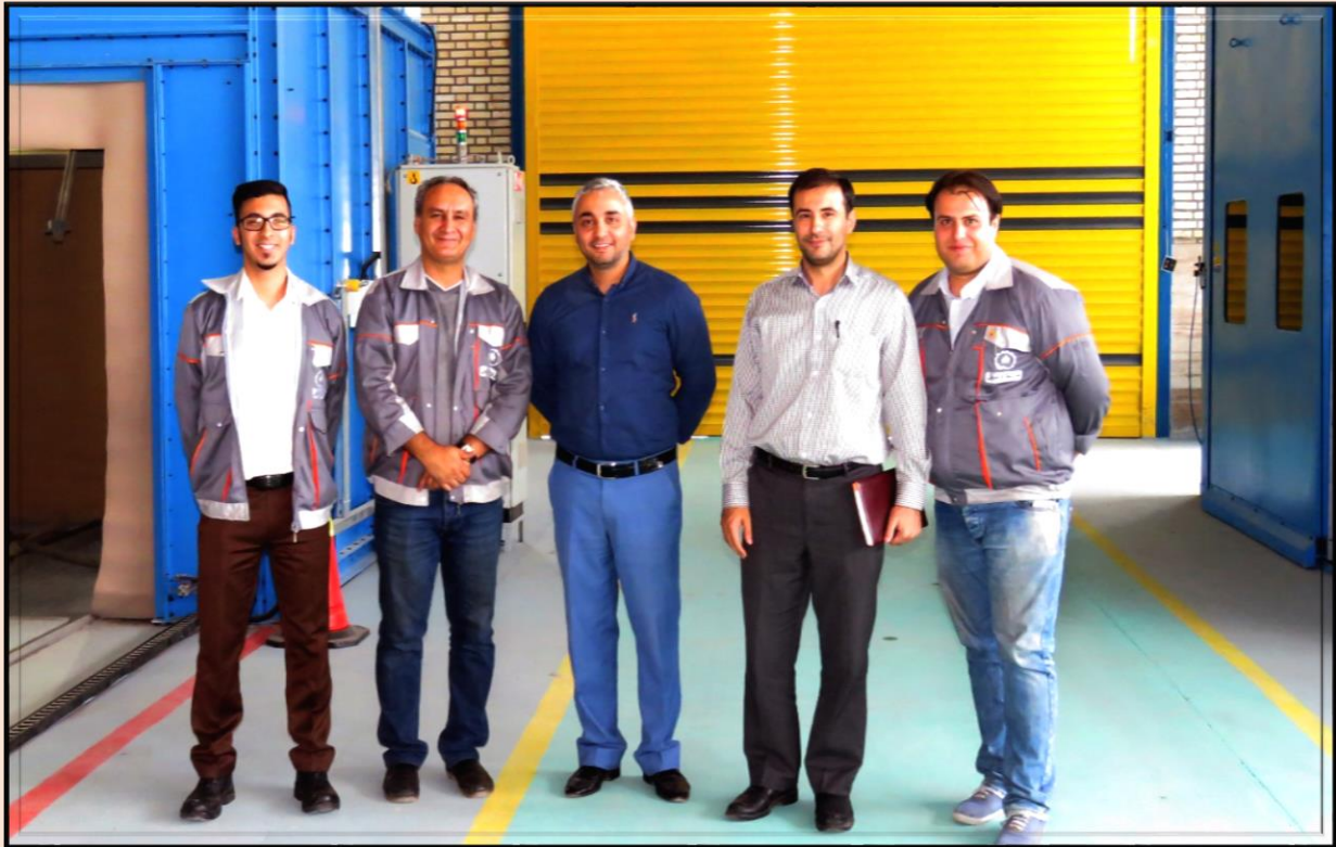
کارشناسان شرکت پالایش و پخش فراورده های نفتی ایران (جهت ثبت در AVL وزارت نفت)