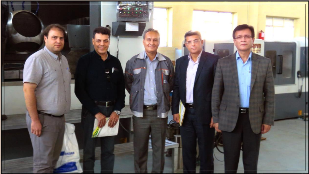
کارشناسان شرکت ملی صنایع پتروشیمی ایران