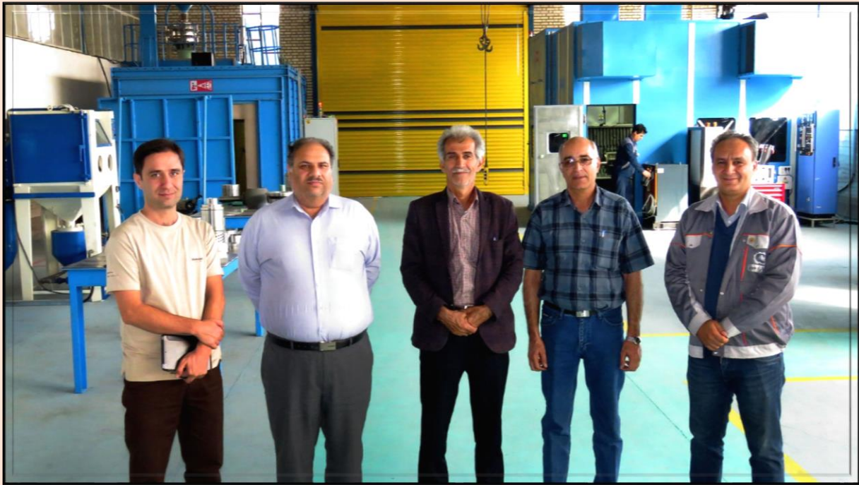
کارشناسان مجتمع پتروشیمی بندر امام خمینی (ره)