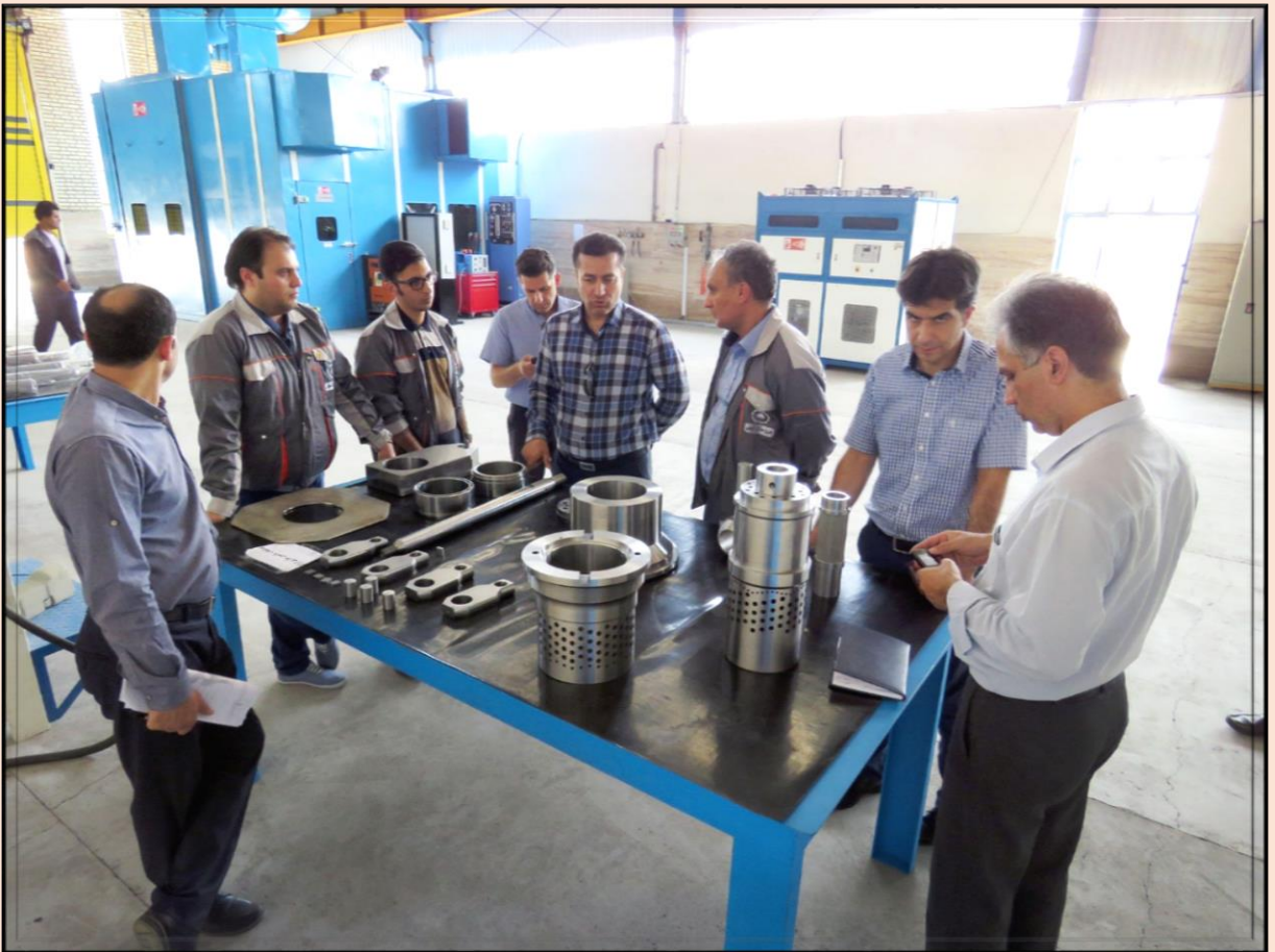
بازدید شرکت خطوط لوله و مخابرات نفت ایران