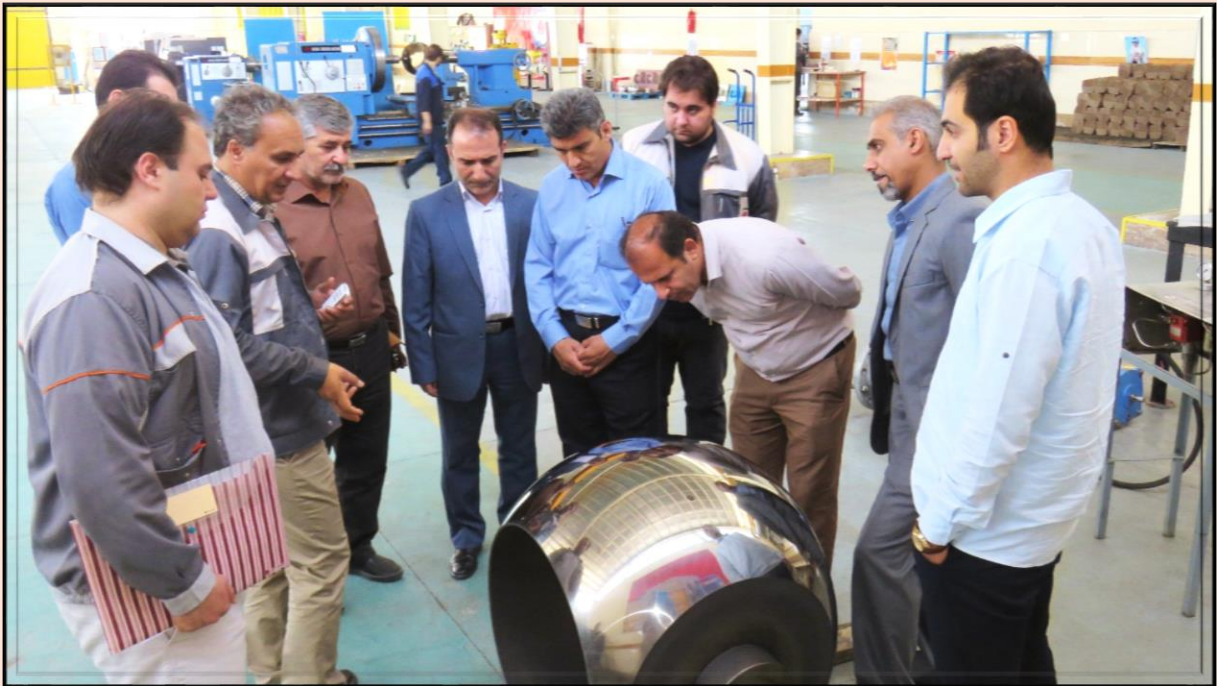
کارشناسان شرکت پالایش نفت اصفهان