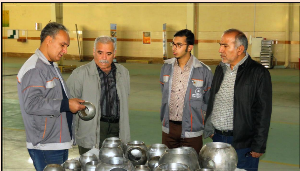
کارشناسان شرکت پلی پروپیلن جم