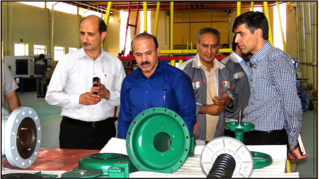
بازدید شرکت نفت فلات قاره ایران