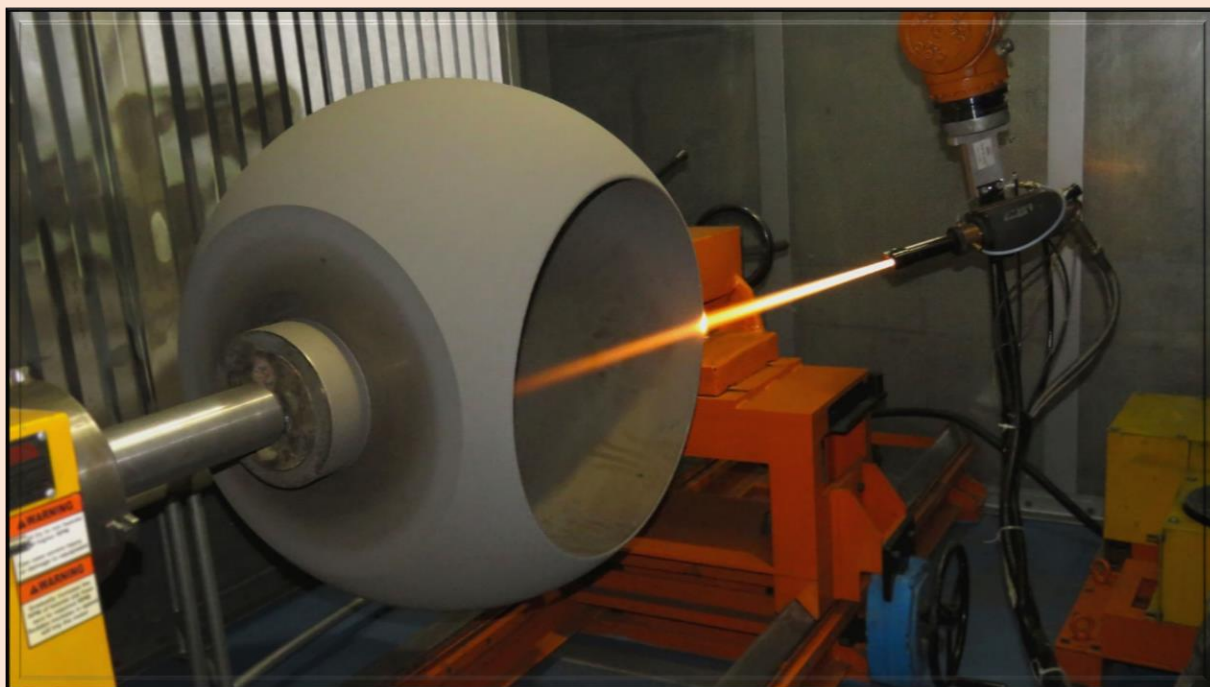
بازدید منطقه 8 عملیات انتقال گاز - تبریز از مراحل پوشش دهی بال 24"