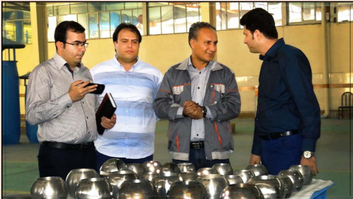
بازدید تیم کارشناسی شرکت ملی حفاری ایران