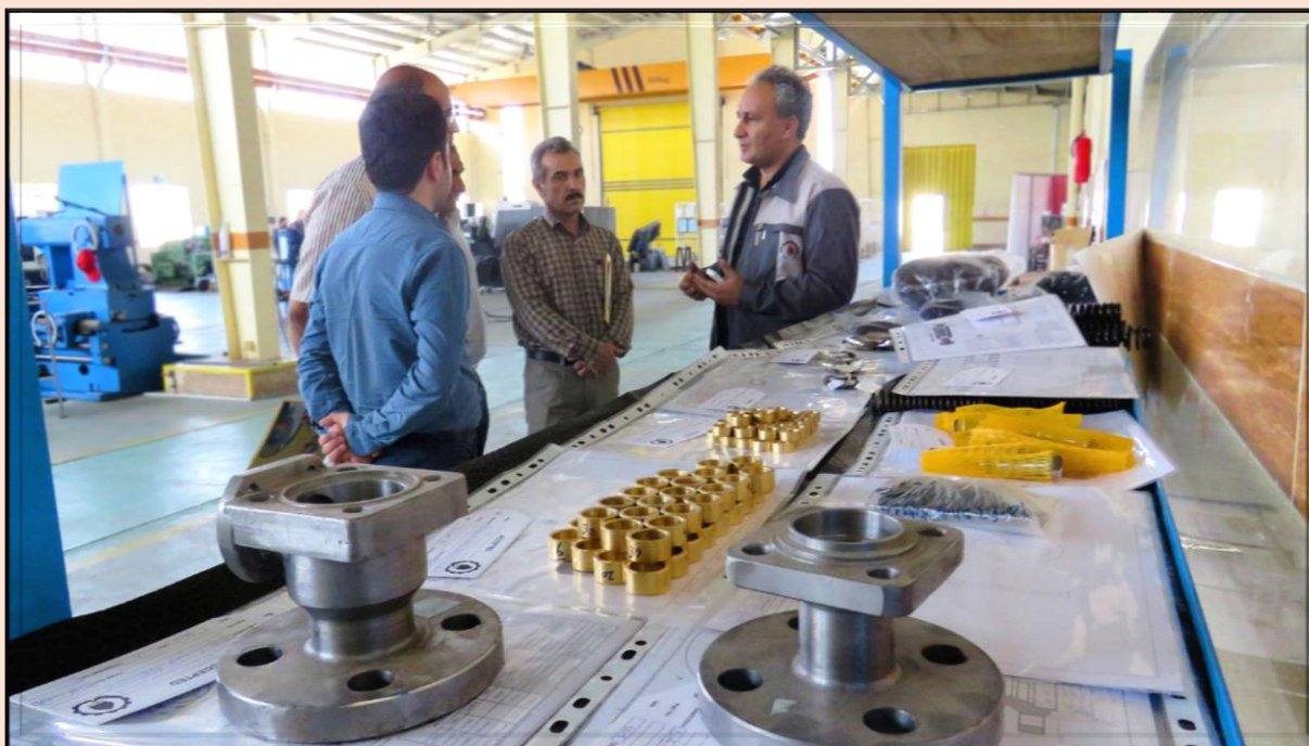
کارشناسان شرکت خطوط لوله و مخابرات نفت ایران - منطقه جنوب شرق (رفسنجان)