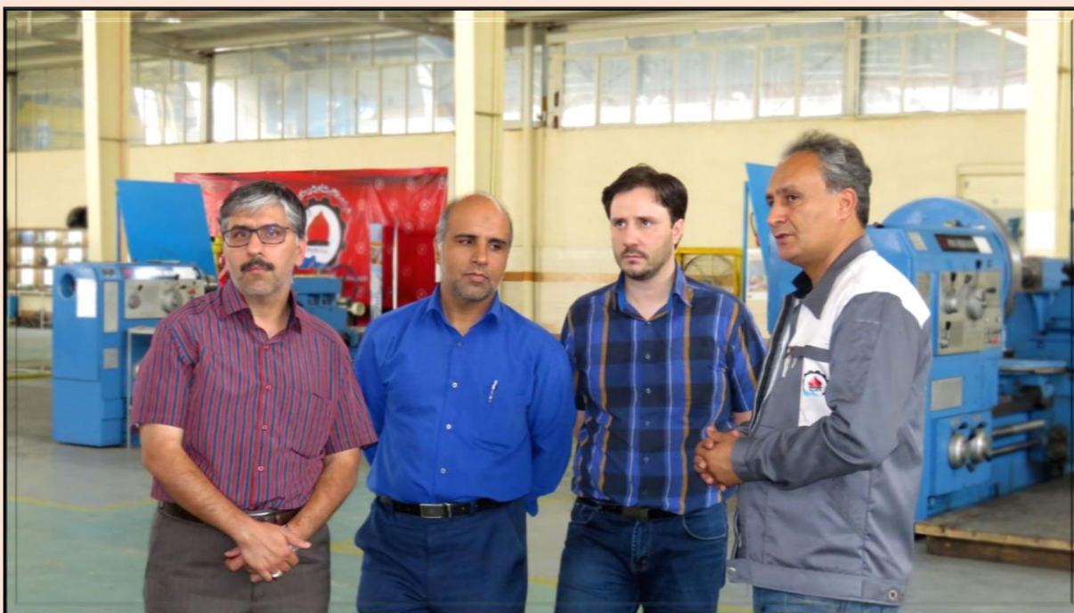
کارشناسان شرکت پالایش گاز شهید هاشمی نژاد - خانگیران