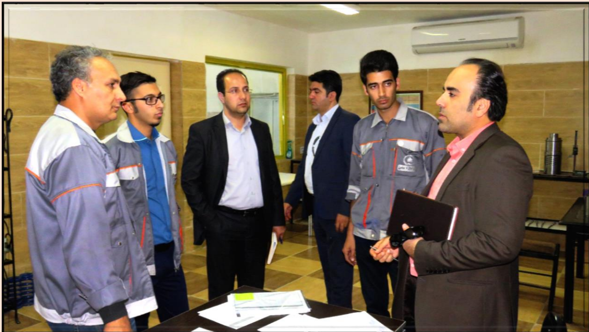
کارشناسان شرکت نفت مناطق مرکزی