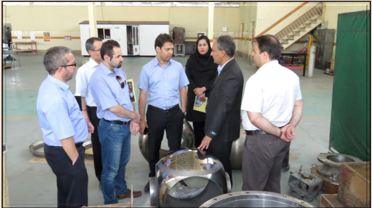
بازرسان گروه مینا-مینا توگا